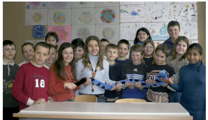
Das Schulnetzmaskottchen «Drachenzahn»