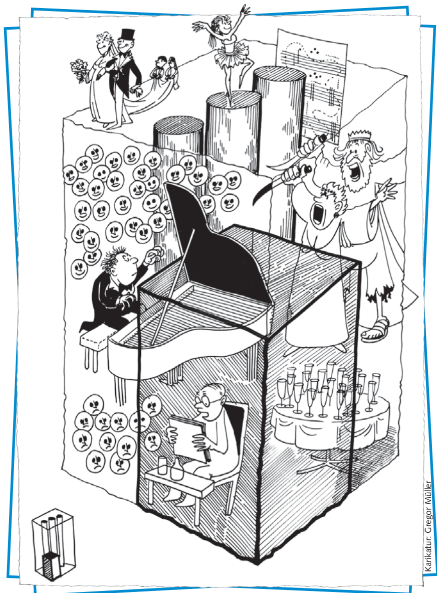
Karikatur: Gregor Müller

« Dank der intensiven Diskussionen mit den Teilnehmerinnen und Teilnehmern der Ideenkonferenz nimmt die künftige Ausrichtung von Schloss Werdenberg konkrete Formen an. Wir sind überzeugt, das Potenzial des einzigartigen Ensembles von Schloss, Städtli und See in Zukunft verstärkt ausschöpfen und die Ausstrahlungskraft nach innen und aussen massgeblich steigern zu können. »