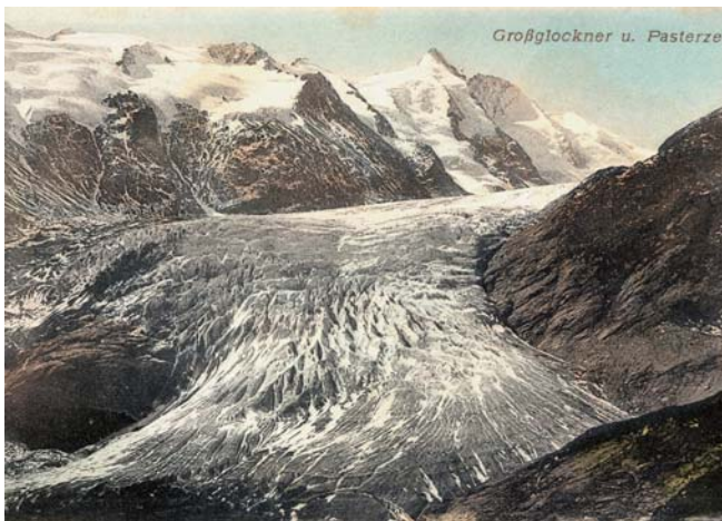
Dramatischer Wandel: Die Pasterze/Pasterzenzunge mit Grossglockner (3798 m), Kärnten/Österreich im Jahre 1900 (oben) und 2000 (unten)

Der Gletscherschwund ist das sichtbarste Anzeichen der weltweiten Klimaerwärmung. Seit Mitte des 19. Jahrhunderts – dem Beginn der Industrialisierung – gehen die Alpengletscher mit bislang ungekannter Geschwindigkeit zurück. Sie verloren von 1850 bis 1975 im Mittel etwa ein Drittel ihrer Fläche sowie die Hälfte ihres Volumens. Seitdem sind weitere 20 bis 30 Prozent des Eisvolumens abgeschmolzen. Der Extremsommer 2003 hat allein fünf bis zehn Prozent der bisher verbliebenen Eisreserven in den Alpen wegschmelzen lassen.