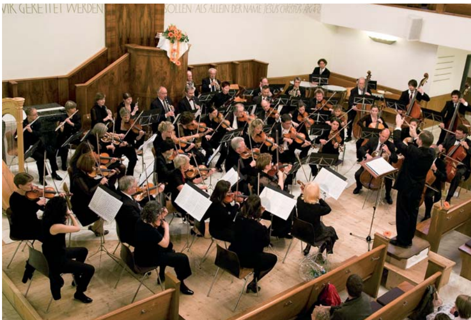
Das Orchester Liechtenstein-Werdenberg am 18. Mai 2008 beim Frühjahrskonzert in der Evangelischen Kirche in Buchs

Dazu kommen je nach Programm noch weitere Aufführungsorte. Die nächste Konzertveranstaltung bildet das Silvesterkonzert am 30. Dezember 2008 in Triesen FL mit beschwingter Musik zum Jahreswechsel (Wiederholung am 4. Januar 2009 um 11.00 Uhr im Kursaal in Bad Ragaz).