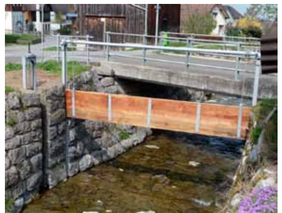
Relikt aus vergangenen Tagen: Mit der kürzlich restaurierten Wassersperre und dem Schieber bei der Erlenbrücke konnte das Löschwasser ins Holand abgeleitet werden.