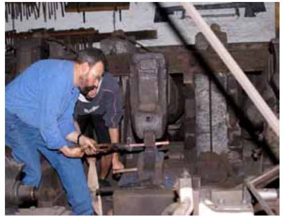
Grosser Hammer: In der Hammerschmiede Sennwald ist auch der schwere Brettfallhammer in Betrieb.

Weitere Informationen finden Sie unter www.grabsermuehlbach.ch .