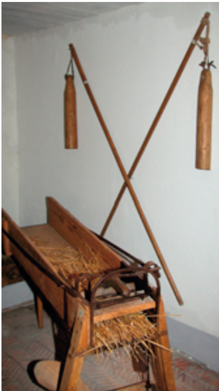
Gut erhalten und gute Beispiele: Schnittstuhl zum Strohschneiden und an der Wand zwei Tröschslegel.