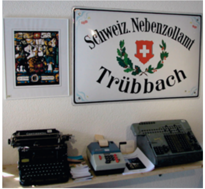
Gegenstände aus dem Geschäftsleben: Die Zolltafel, die Kopie einer Wappenscheibe sowie Schreib- und Rechenmaschinen.

Auslöser für diese Sammlung war auch die Schenkung einer der letzten funktionstüchtigen Stickmaschinen der Gemeinde Wartau. Die Stickerei spielte eine bedeutende Rolle in dieser Gemeinde. Zirka 1870 wurde die erste Stickmaschine im Wartau in Betrieb genommen. In der Blütezeit standen in Oberschan 94, in Wei- te 75, in Trübbach 36, in Azmoos 15 und in Malans 22.