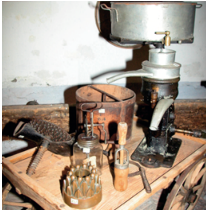
Gerätschaften für den Haushalt: Zentrifuge (hinten), Maisschälgerät (links), Butterzentrifuge (Mitte), Chriesi-Entsteiner (rechts, mit Stöpsel) und exklusive Gugel-hopfform (vorne).