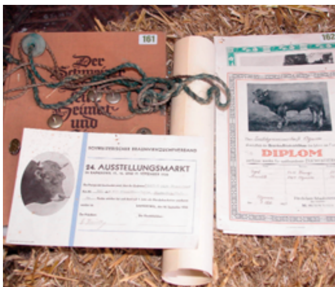
Dokumente eines wichtigen Erwerbszweiges: Die Landwirtschaft mit Viehhaltung und Ackerbau war und ist für die Gemeinde Wartau von grosser Bedeutung.