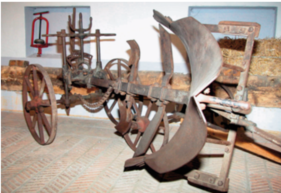
Eindrückliches Beispiel aus der Landwirtschaft: der Selbstthalteflug.

Nach dem Kauf durch die politische Ge- meinde im Jahre 1981 war die Liegenschaft verpachtet, bis 1992. Dann begannen die