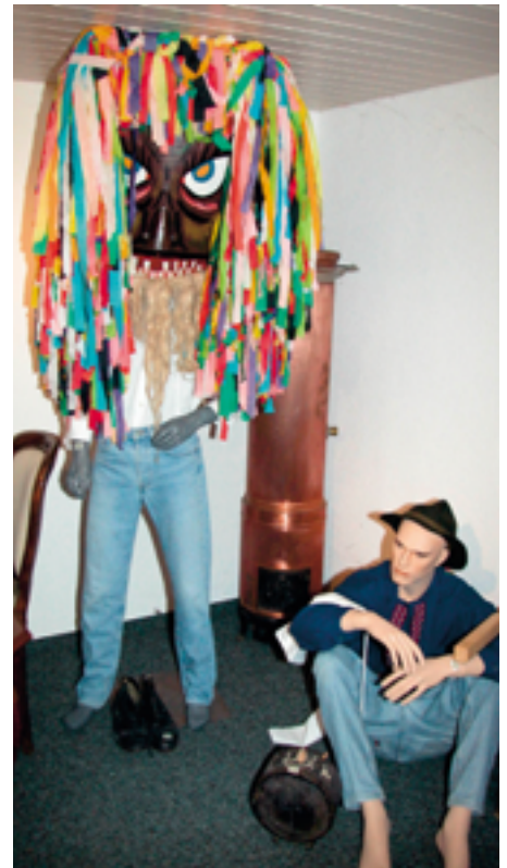
Chlausmaske und Flaschenträger (sitzend): In Oberschan wird schon seit uralten Zeiten «gchlausnat».