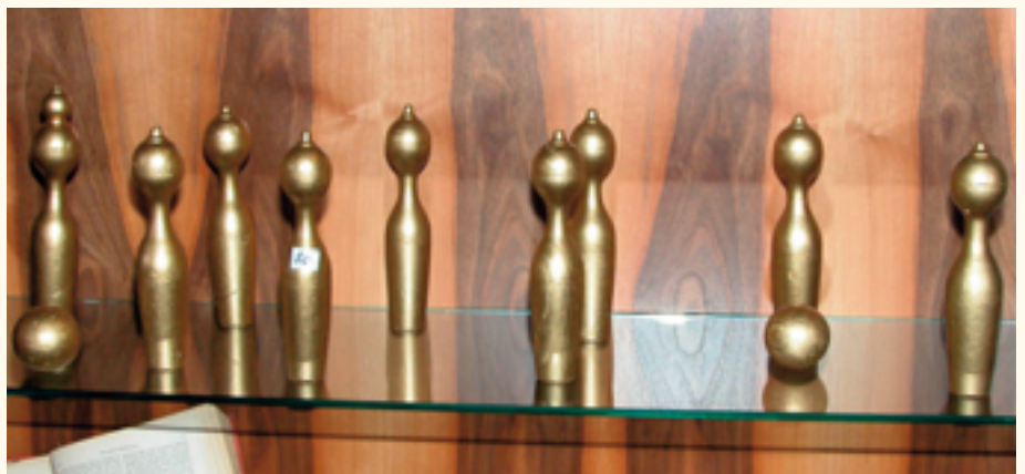
Als «Corpus delicti» an den Ort des Geschehens zurückgebracht, sorgt es noch heute für einiges Schmunzeln: «Ds goldig Kegelspiel».