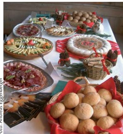
Qualität aus der Region