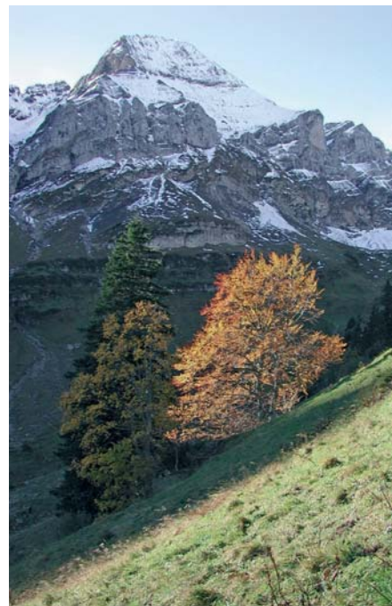
Reizvolle Naturlandschaften prägen das Bild.

Mittlerweile haben die Eidgenössischen Räte in der Herbstsession 2006 die gesetzliche Grundlage für die Schweizer Parkgebiete geschaffen und einer entsprechenden Änderung des Bundesgesetzes über den Natur- und Heimatschutz (NHG) zugestimmt. Jetzt gilt es, die vorhandenen Projekte in einem Projektgesuch an den Bund zusammenzufassen und die Zustimmung der Gemeinden bis zum Frühjahr 2007 einzuholen. Danach kann das Finanzierungsgesuch beim Bund eingereicht und bei einer positiven Antwort mit dem Aufbau eines Naturparks bzw. der Umsetzung der ersten Projekte begonnen werden.