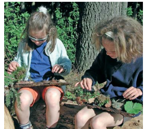
Natur erleben, begreifen, verstehen