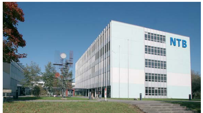
Die NTB – auf Partnersuche in der Wirtschaft