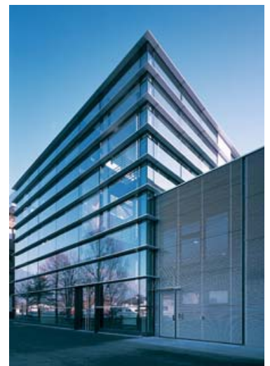
Unaxis AG, Balzers, TechReg-Partner

Um diese Strategie umzusetzen, wurde im Mai 2006 eine Koordinationsstelle für Standortförderung und Technologietransfer an der NTB ausgeschrieben. Ab Herbst 2006 soll diese «Schlüsselstelle» die operative Tätigkeit starten. Für PERSÖNLICHKEIT WERDENBERG und damit für die gesamte Region ist diese Nachfolgelösung der TechReg ein bedeutender Meilenstein. Die Hochschule sowie die beteiligten Partner engagieren sich somit in hohem Masse für die lokale Wirtschaft.