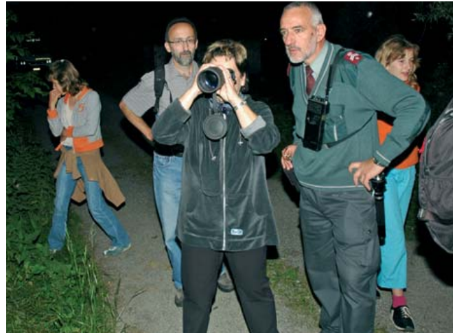
Mit dem Nachtsichtgerät den Schmugglern auf die Schliche kommen

Für die Veranstalter selber ging es darum, auf das touristische Potenzial im Dreiländereck aufmerksam zu machen. Das ist ihnen hervorragend gelungen, obwohl der Grosseaufmarsch auch Grenzen des Machbaren aufzeigte.